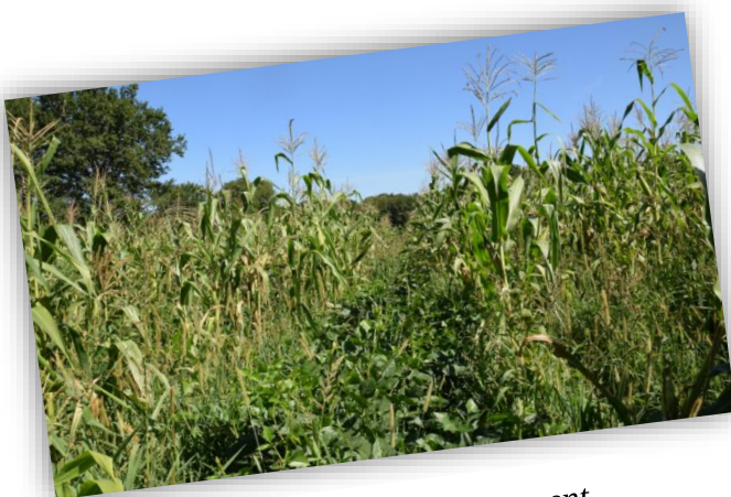
Maïs semé à 160 cm d'écartement