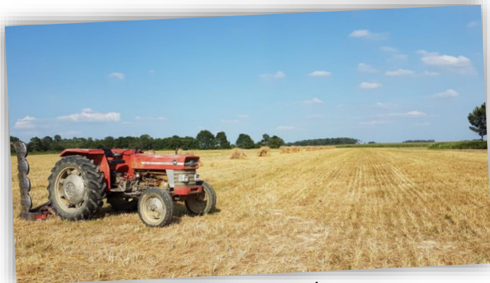
Réalisation des gerbes

Retour en images sur les diverses actions menées :