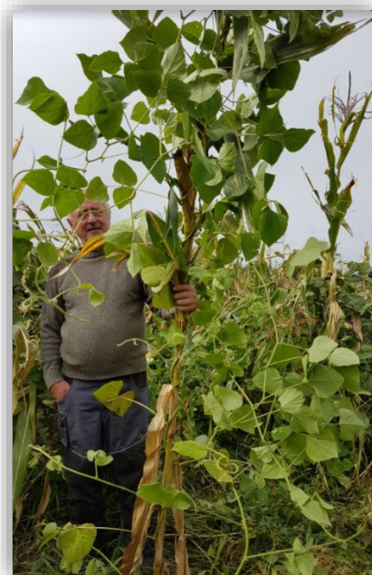
Maïs associé haricot lab lab