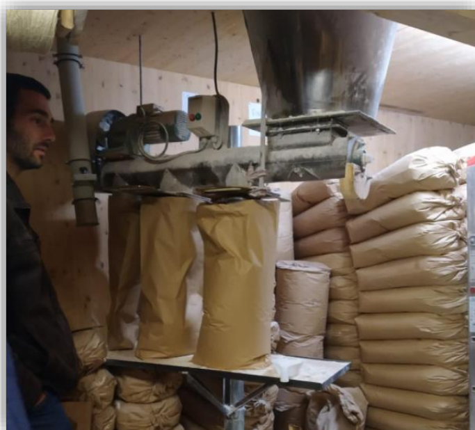
De la qualité