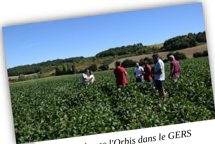
Soja bio biné avec l'Orbis dans le GERS