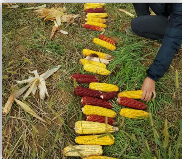
Atelier sélection maïs paysan