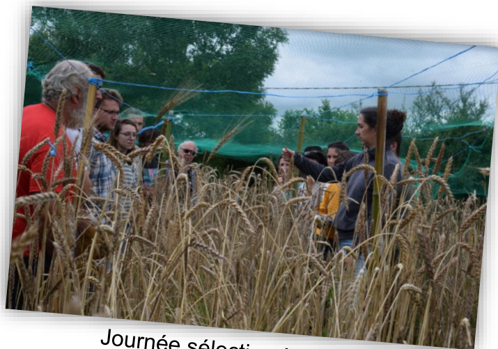
Journée sélection à Béguios