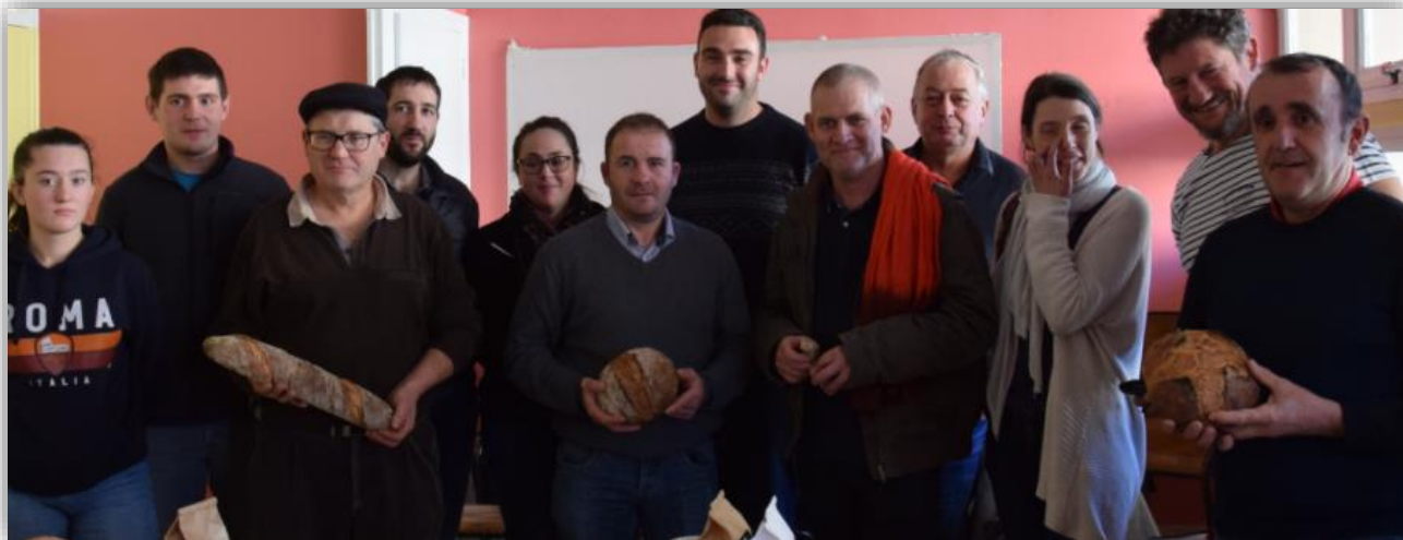
De la convivialité

Retour en images sur les actions menées :