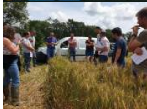
Visite de la plateforme de céréales à paille