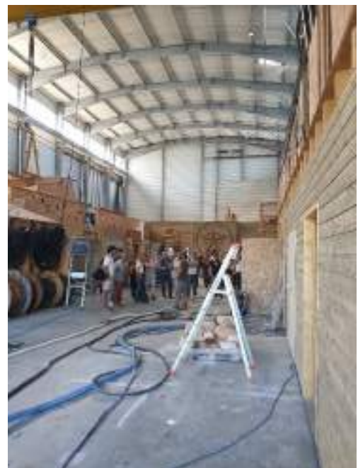
Atelier de sensibilisation aux utilisations du chanvre dans le bâtiment