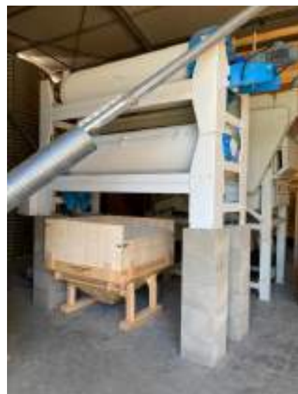
Les machines sont progressivement montées même s'il manque toujours l'électricité