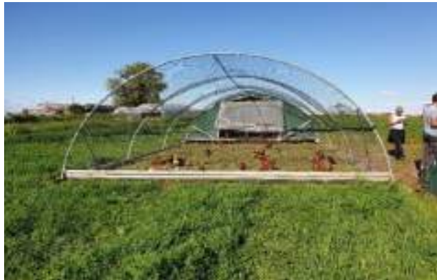
Poulailler mobile lors du voyage d'étude