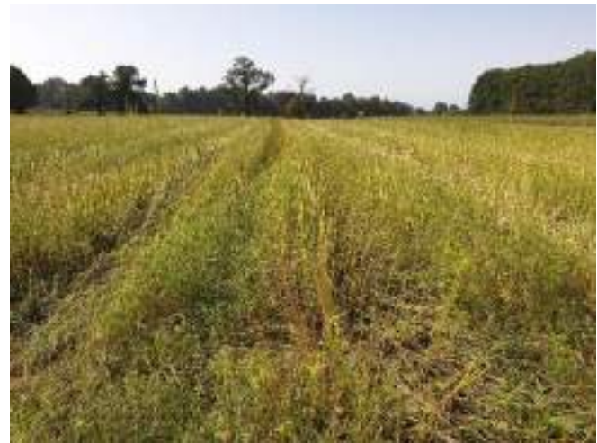
Récolte des graines de chanvre