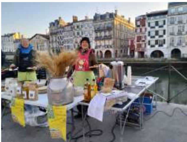
Ventes de crêpes lors de la campagne de financement participatif