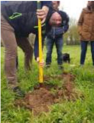
Encore un chercheur d'or...