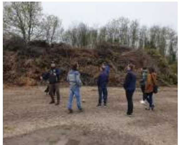
Visite de la plateforme de compost dans le Lot et Garonne