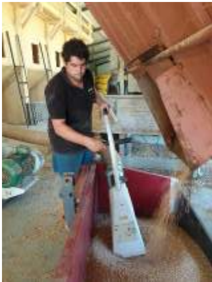
Le grain commence à être livré