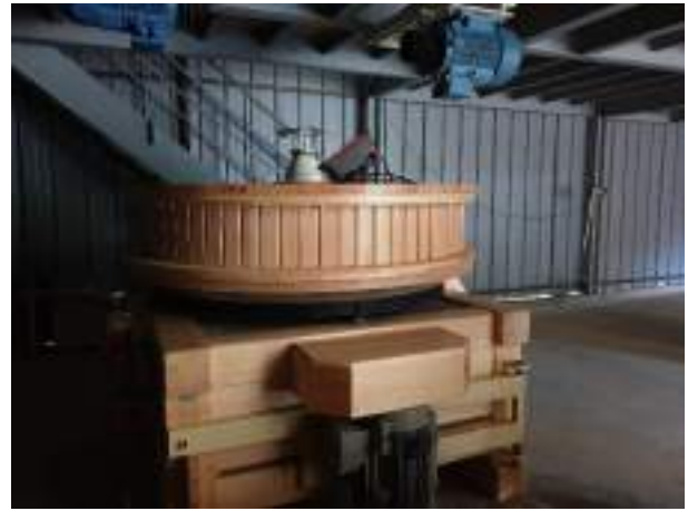
On peut enfin prendre des notes avec la lumière