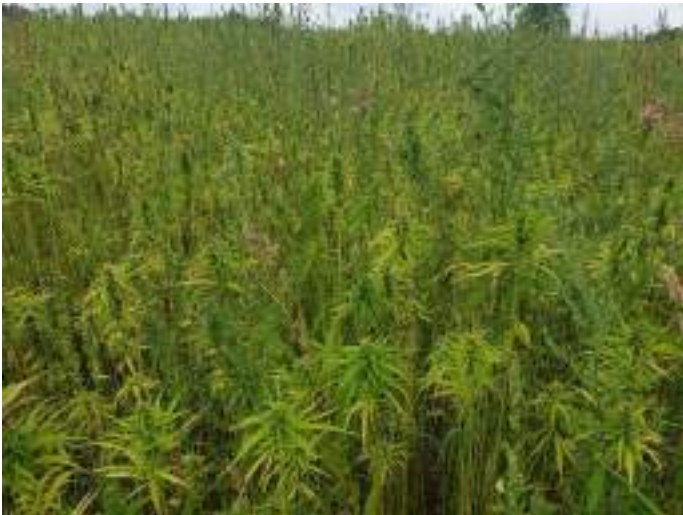
Champ de chanvre