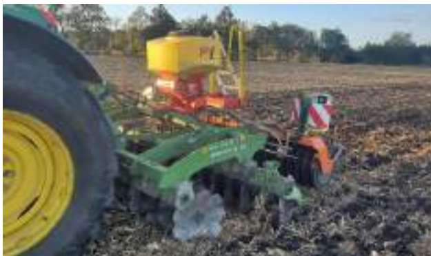
Mise en place de la plateforme variétale de couverts végétaux