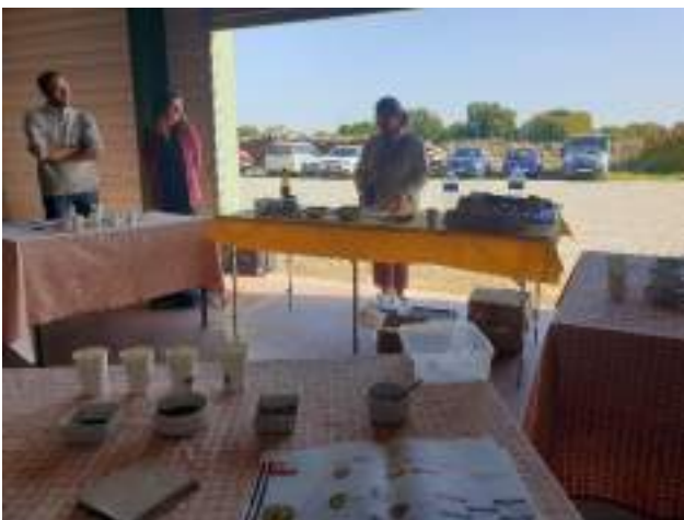
Atelier de sensibilisation alimentaire