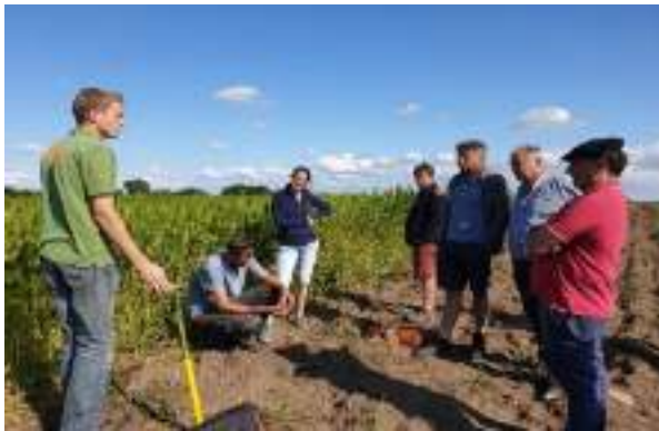
Visite d'un champ de chanvre