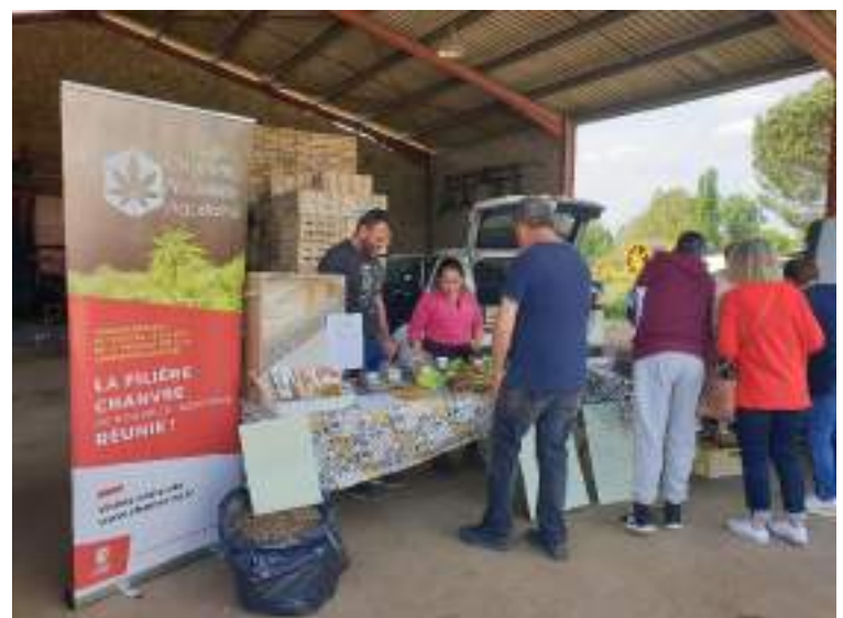
Vente à la ferme et sensibilisation des consommateurs