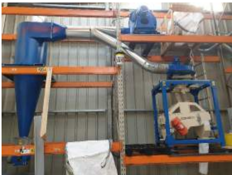
Décortiqueuse : futur investissement ?