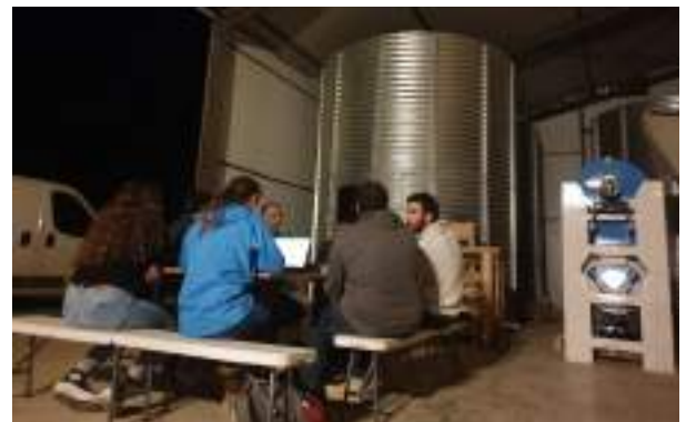
Plusieurs réunions à cogiter jusqu'au bout de la nuit