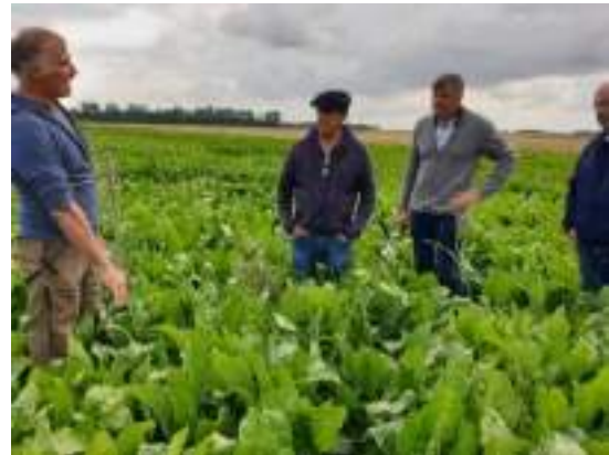
A la découverte de la betterave